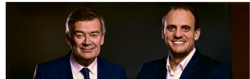
PHILIPPE HOURDAIN PRÉSIDENT DU CONSEIL D'ADMINISTRATION BANQUE POPULAIRE DU NORD

*Résolution soumise au vote lors de l'Assemblée Générale du 26 mai 2026